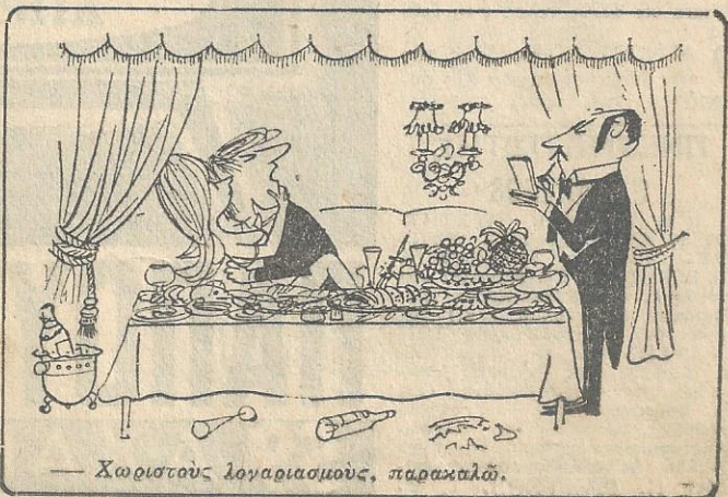
— Χωριστους λογαριασμούς, παρακαλώ.